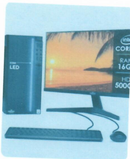
Computador Completo Intel Core I5 16GB HD 500GB Monitor 17"