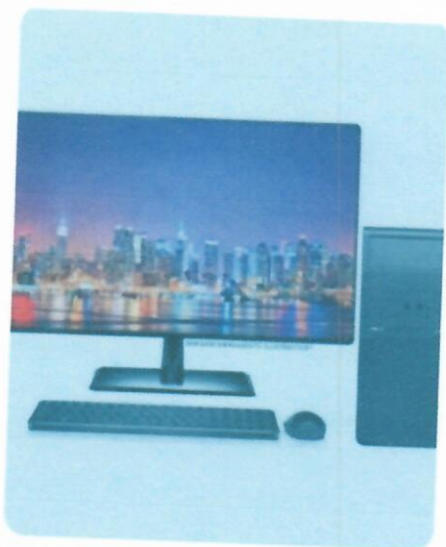
Computador Completo Desktop Intel Core I5 16GB Monitor 19.5"